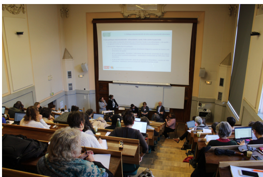
L'assemblée du séminaire lors de la table ronde du matin