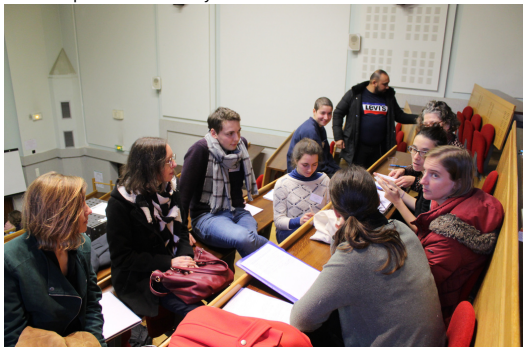
Discussions lors des ateliers de l'après-midi